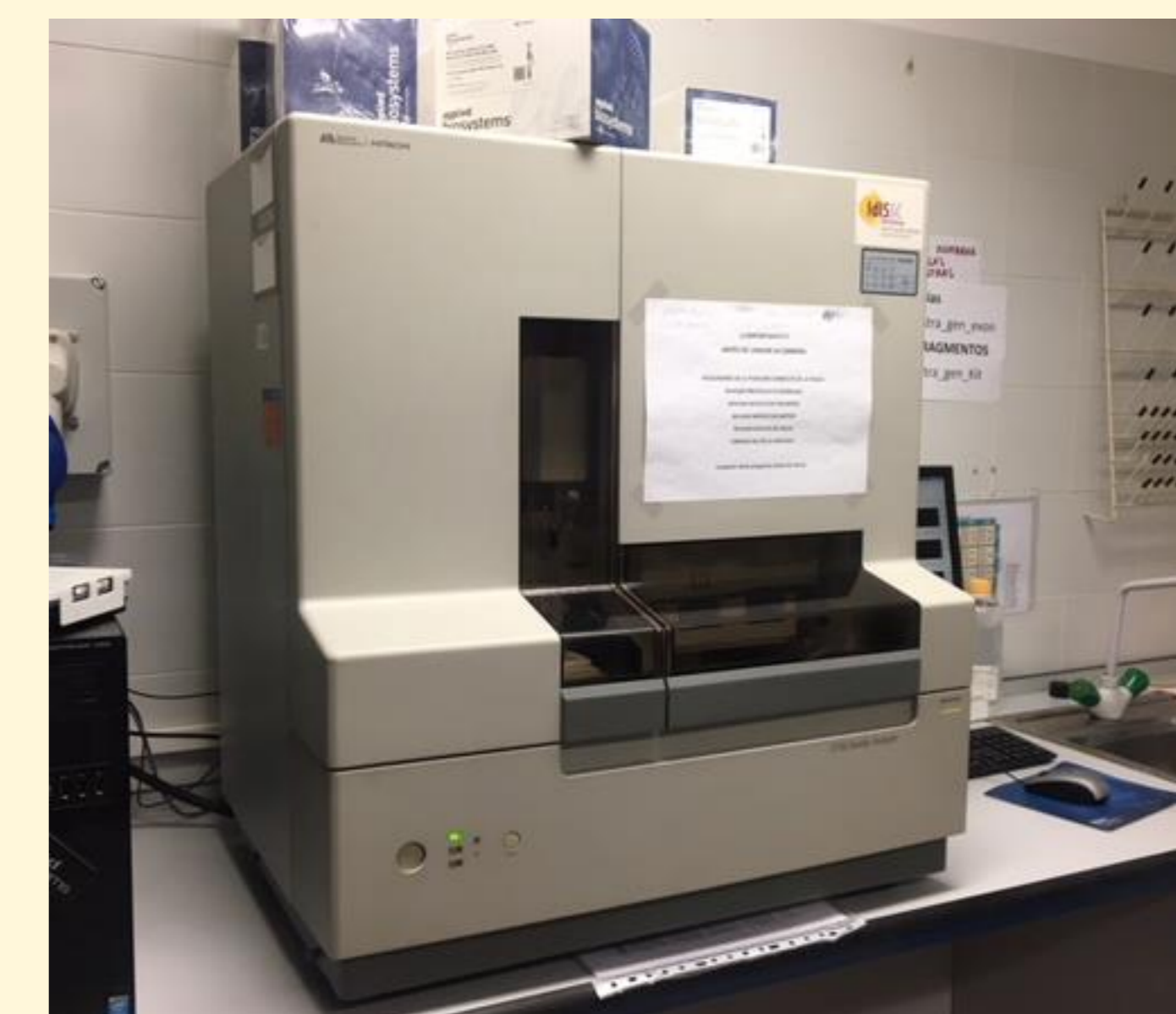
Figura 2. Secuenciador masivo AB13130 (Applied Biosystem)