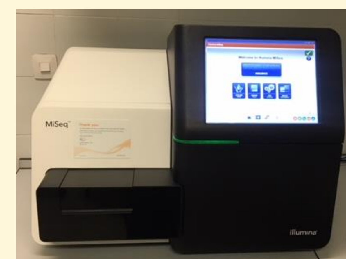
Figura 3. Secuenciador capilar MiSeq (Illumina)